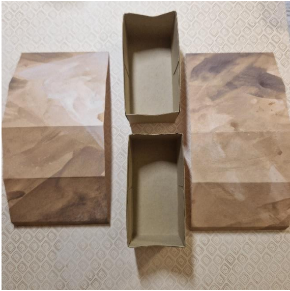
2 große Schubladen und 2 Hüllen