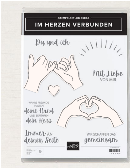
ABBILDUNG IN 100 %

Stempelset Im Herzen verbunden + Stanzformen Worte von Herzen Nur erhältlich, solange der Vorrat reicht